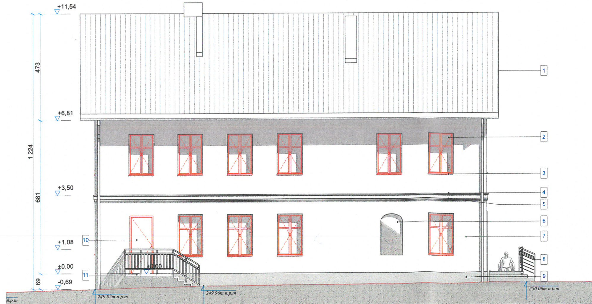
04 ELEWACJA PÓŁNOCNA RYS. NR 06 SKALA: 1:100 (A3)